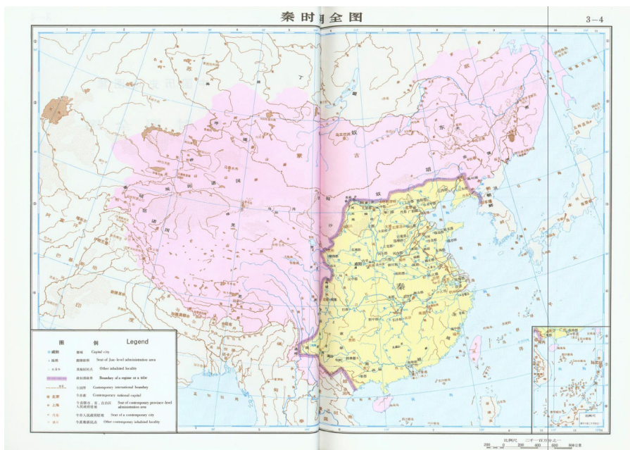
Figura 1. Mapa completo del período Qin.

sugiere que, en distintos períodos, el sistema tributario se vinculó con dinámicas expansivas del imperio (Figuras 1, 2 y 3). En particular, el territorio imperial —con una superficie aproximada de 289.000 km 2 en sus etapas formativas en la llanura central— alcanzó su máxima extensión hacia 1790, durante la dinastía Qing, con cerca de 13.100.000 km 2 , superando incluso, en términos territoriales, la extensión actual de 9.596.960 km 2 de la República Popular China. Esta trayectoria histórica pone de manifiesto la coexistencia de tendencias expansionistas y pacifistas en distintos momentos, ninguna de las cuales puede considerarse por sí misma una característica inherente o atemporal. En última instancia, la idea de gobernar todo “bajo el Cielo” les proporcionó a los emperadores un marco ideológico para legitimar tales procesos de expansión.