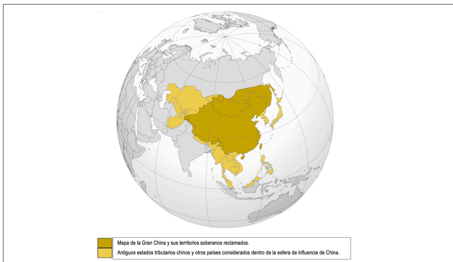
Figura 5. Gran China con estados tributarios. Nota: Se han respetado los títulos y las indicaciones originales en chino, los cuales han sido traducidos de forma literal y no representan la opinión del autor. El mapa no presenta una datación específica ni referencia a una dinastía en particular, sino que constituye una representación general de las naciones que en algún momento fueron tributarios de China.

convirtieron en colonias y, con el tiempo, en Estados independientes. 12 En todos los casos, se disolvió el vínculo jerárquico que los integraba al sistema y se redefinieron como unidades soberanas dentro del sistema internacional (Figura 5).