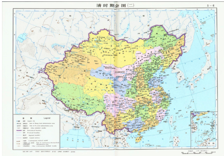
Figura 3. Mapa completo del período Qing (2) - Año 34 del reinado del emperador Guangxu (1908).