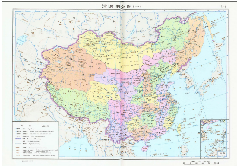
Figura 2. Mapa completo del período Qing (1) - Año 25 del reinado del emperador Jiaqing (1820).