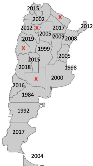
Figura 1. Año de sanción de cada ley provincial de AIP.

verá en el mapa que se presenta a continuación el año de sanción de cada ley provincial de AIP. Las provincias con una cruz (Formosa, La Pampa, San Juan y Tucumán) son las que aún no cuentan con ley provincial de AIP.