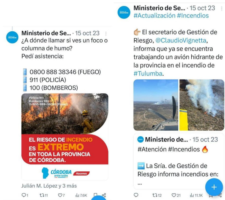
Figura 12. X del Ministerio de Seguridad de Córdoba.