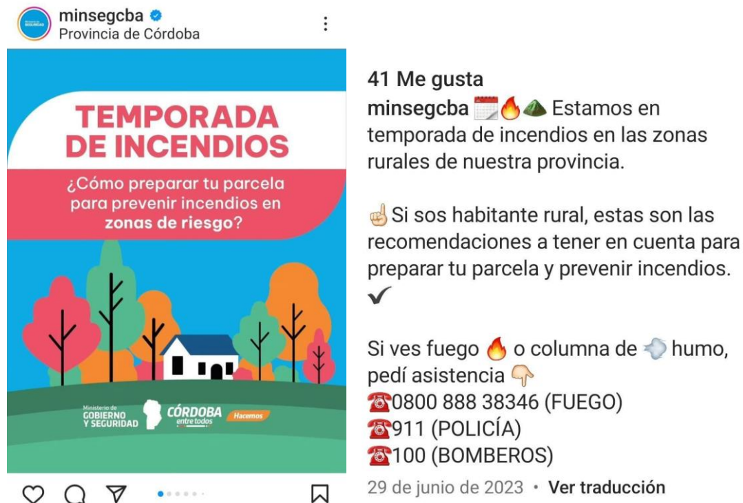
Figura 11. IG del Ministerio de Seguridad de Córdoba.