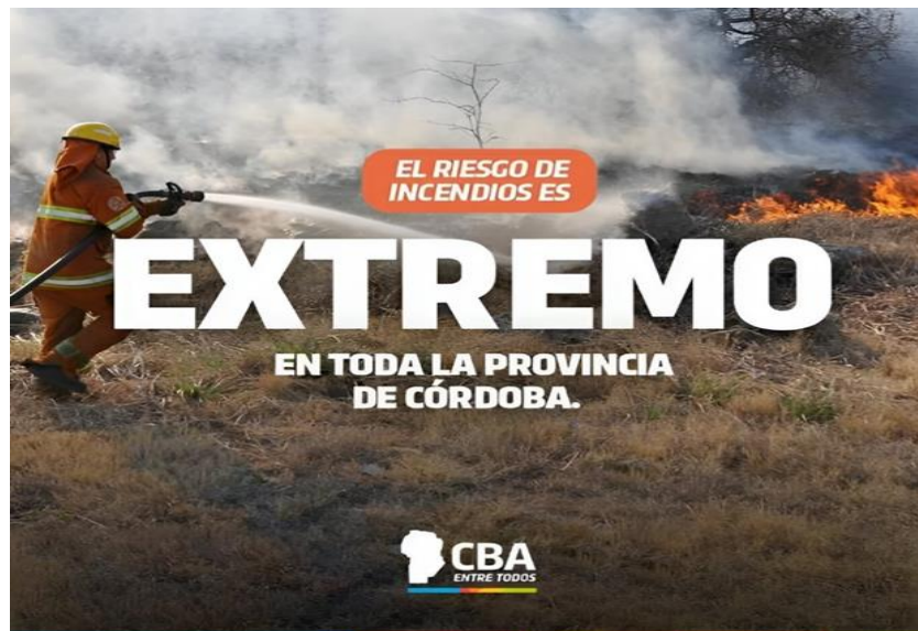
Figura 4. Ejemplo de campaña de acción específica en momento crítico.

Una debilidad de este tipo de mensajes es que suelen ser genéricos y carecen de adaptación a las características de las comunidades expuestas a los incendios forestales, las que tienen una escasa participación en el diseño y la ejecución de estas campañas, todo lo cual limita la apropiación de los mensajes. A ello se suma la falta de evaluaciones continuas, desde el gobierno provincial, del impacto que estas acciones producen sobre las poblaciones a las cuales se dirigen.