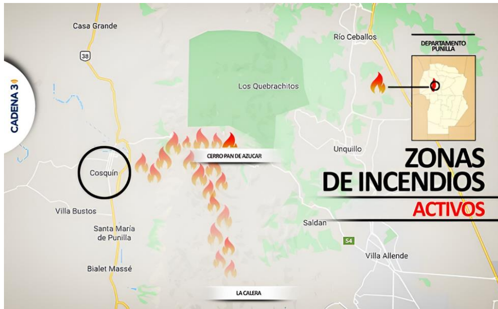
Figura 10. Zona de incendios forestales activos.