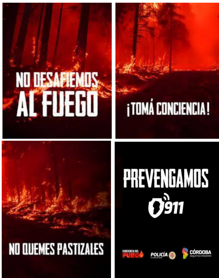
Figura 3. Ejemplo de mensaje en redes sociales.

Las campañas específicas en momentos críticos del calendario de incendios en Córdoba ponen foco en la concientización y sensibilización ciudadana durante los períodos de mayor peligro. Estas acciones incluyen mensajes en redes sociales, presencia en medios de comunicación y actividades con instituciones educativas presentes en las zonas más expuestas. Se utilizan mensajes simples y directos como “No desafíemos al fuego”, “Tomá conciencia” y “No quemes pastizales”, y se difunden a partir de una articulación interinstitucional con organismos como Defensa Civil, Bomberos y el Plan Provincial de Manejo del Fuego.