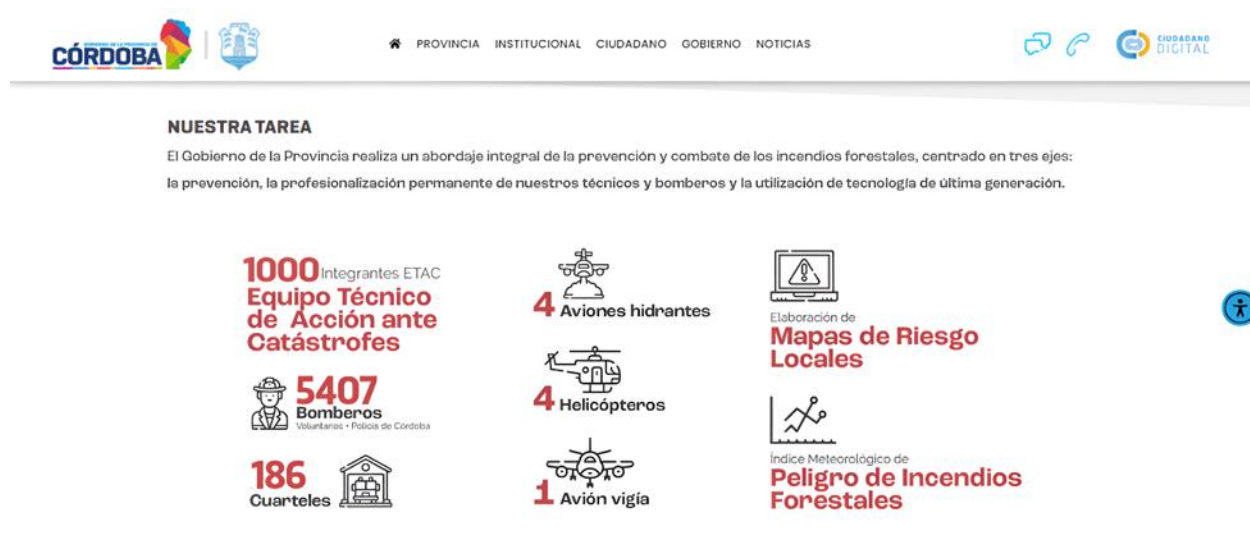
Figura 6. Ejemplo de accountability en la Gestión del Riesgo de Desastres.