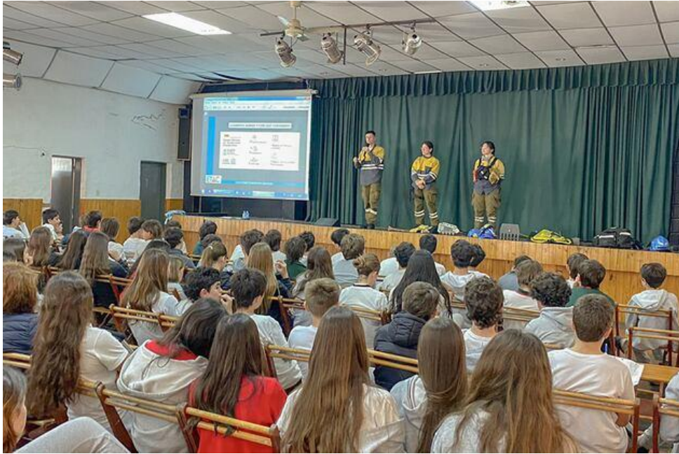
Figura 8. Capacitación en escuelas.