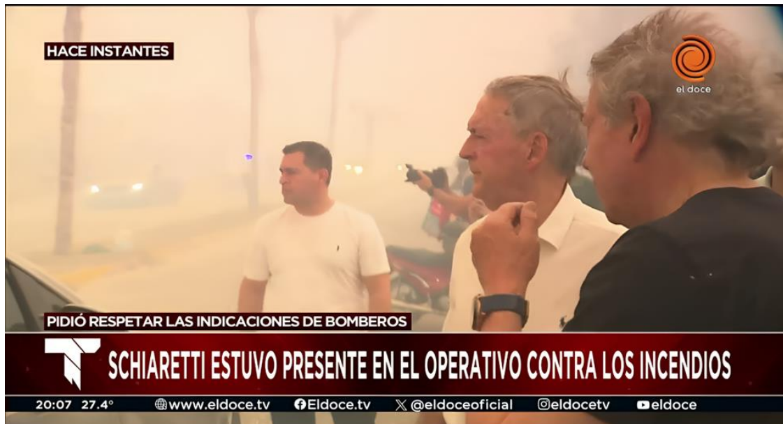
Figura 7. Ejemplo de participación activa por parte del gobierno en situaciones de crisis.