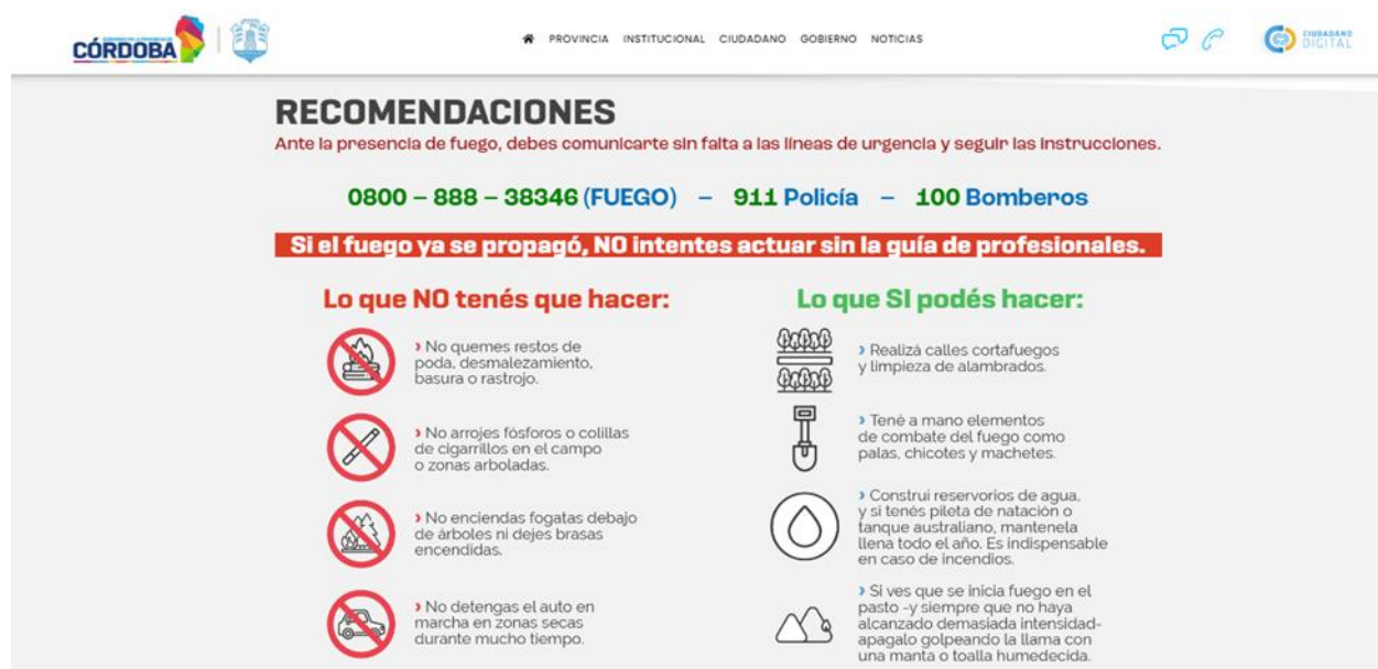
Figura 9. Recomendaciones de acción ante incendios forestales.