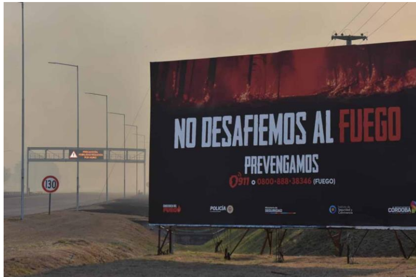
Figura 2. Cartelería fija en zona de alto riesgo en ruta serrana.

(Fuente: https://beleninfo.com.ar/cordoba-incendio-en-la-zona-de-la-mezquita-cortaron-la-autopista-a-carlos-paz-y-hay-cuatro-bomberos-heridos/ ).